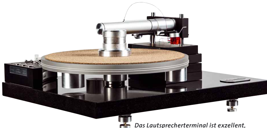
Das Lautsprecherterminal ist exzellent, will aber praktisch ausschließlich mit Kabelschuhen bedient werden

City Audio Trade www.cityaudiotrade.com 2 Jahre ca. 45 x 18 x 35 cm ca. 20 kg