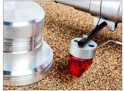
Das Benz ACE SL ist leider nicht mehr zu bekommen, spielt aber exzellent an diesem Tonarm

Zum Einen ist er nämlich nicht klappbar, will sagen Er ragt immer über die Telleroberfläche und man muss die Platte beim Wechseln oder Umdrehen grundsätzlich darunter her „fädeln“. Mit dem klappbaren Arm geht's zweifellos komfortabler, man gewöhnt sich aber auch an das hier erforderliche Procedere.