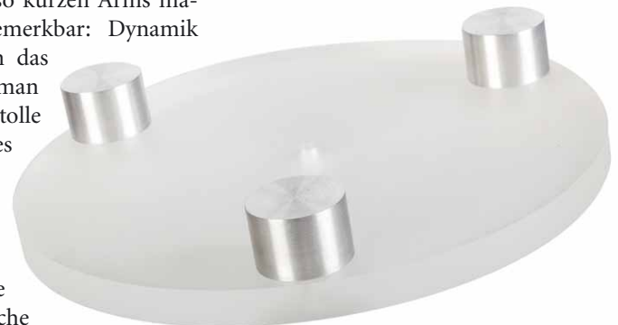
Drei Aluminiumgewichte erhöhen das Trägheitsmoment des Acryltellers

nämlich fummelig. Auch wenn der Hersteller keine Angaben über die effektive Tonarmmasse macht – mit „mittelschwer“ liegen wir definitiv richtig. An diese Kategorie passt auch das Benz Micro ACE SL, dass sich schon unter dem ASP-1501 bestens bewährt hat. Sorgfalt bei der Justage rentiert sich definitiv, der kleine Pre Audio ist nämlich klanglich ein Wucht. Und das meine ich erst einmal wortwörtlich, denn die Qualitäten eines so kurzen Arms machen sich sofort bemerkbar: Dynamik pur ist angesagt. Um das festzustellen, kann man beispielsweise die tolle MFSL-Neuausgabe des Dire Straits-Klassikers „Communique“ bemühen, mehr als ein paar Takte von „Once Upon A Time In The West“ brauche ich dafür immer nicht. Hier hat das Schlagzeug massig Drive und Attacke, genau so muss das sein. Davon ab klingt's schön flüssig, geschmeidig und tonal bestens ausgewogen – so kenne ich das von dem Benz. Hören wir mal in die tolle „Return To Forever“-Reunion von 2008 hinein. Das funktioniert bestens, der Pre Audio behält die Übersicht bei dem komplexen Geschehen auf der Bühne in erfreulichem Maße. Auch hier fällt das Schlagzeug durch Kontur und Antritt auf, Earl Klugh's Gitarre klingt so geschmeidig, wie sie es nur bei Earl Klugh tut. Das passt alles ausgezeichnet und liefert Klangqualität weit oberhalb dessen, was in dieser Preisklasse üblich ist.