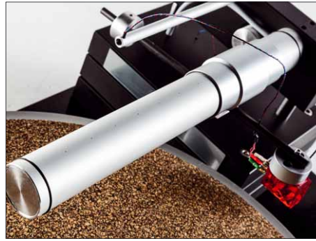
Durch die feinen Bohrungen an der Oberseite des Rohrs strömt die Lagerluft