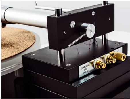
Durch Lösen der beiden kleinen rückwärtigen Schrauben kann man den Arm in der Höhe verstellen