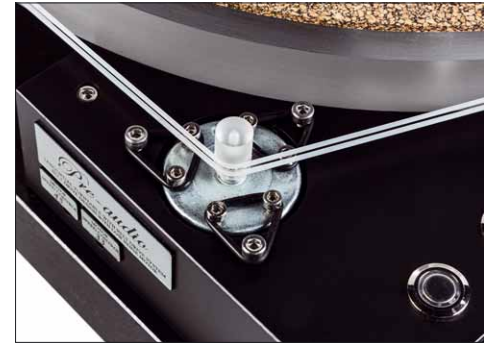
Das Drehmoment des Motors gelangt über zwei weiche Silikonriemen zum Teller

höheren erforderlichen Luftstroms. Er sitzt nunmehr mit im Netzteil des Gerätes und werkelt dort genau so unauffällig vor sich hin wie der „Direktantrieb“ des ASP-1501. Das im Durchmesser deutlich vergrößerte „Lagerrohr“ des DE-1800 gefällt mir aus Stabilitätsgründen gut, in Sachen Bedienung gestaltet sich der Tonarm unproblematisch. Ungewöhnlich ist lediglich die Bedienung des Lifthebels, die geht nämlich gegen den üblichen Standard: Hebel nach oben, Tonabnehmer nach unten.