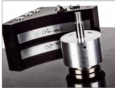
Der Lagerblock ist fest verschlossen, man kann die Magnanordnung nicht inspizieren