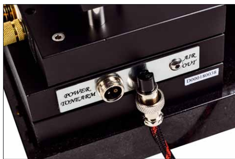
Durch diesen Verbinder geht nicht nur Strom, sondern auch Luft vom Kompressor im Netzteil

Zwischen beiden Modellen gibt es eine ganze Reihe konstruktiver Unterschiede. Interessanterweise ist der neue kleine Dreher nicht in jedem Fall der mit den schlechteren Karten. Das beginnt schon damit, dass als Basis für den DE-1800 eine solide, drei Zentimeter starke Granitplatte zum Einsatz kommt. Diese ruht auf drei mit nadelspitzen Spikes bewehrten Aluminiumfüßen, die feinfühlig in der Höhe verstellbar sind. Der Einsatz der mitgelieferten Spike-Untersetzer ist extrem empfehlenswert, sonst gibt's unschöne Andenken auf der Oberfläche des Unterbaus. Jener solle einmal mehr von der stabileren Art sein, auch wenn das Tellerlager ein gewisses Maß an Schwingungsentkopplung in der Vertikalen bietet. Das liegt daran, dass in dem verschlossen und dadurch vor neugierigen Blicken geschützten Lagerblock ein Magnetlager steckt, das den Teller in der Vertikalen frei schweben lässt, also auf die Unterstützung in dieser Richtung mit einer Lagerkugel oder Ähnlichem gänzlich verzichtet. Ohne aufgesetzten Teller hängt das Lager in seiner oberen Begrenzung,