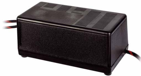
Nicht nur Netzteil, sondern auch Druckluftherzeuger: Der Kompressor sitzt mit in diesem Gehäuse