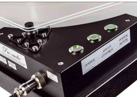
Der Motor hängt elastisch in drei Gummiriemen, die Verbindung zum Teller besorgen zwei Silikonriemen

wie die Tonarmhöhe über dem Teller. Jene bestimmt, genauso wie beim Drehtonarm, den vertikalen Abtastwinkel des Tonabnehmers. Der Tonarm ist über zwei „Türmchen“ mit dem Unterbau verbunden, lässt sich also nicht verdrehen. Das Einstellen der korrekten Tonabnehmerposition erfolgt über das Verschieben des Armrohrs unter der Lagerhülse, dafür muss man eine kleine Madenschraube lösen.