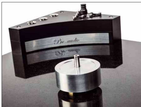
Tellerlager und Antrieb: Ersteres ist fest verschlossen, der Motor ist ein geregeltes Gleichstrommodell