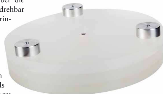
Der Plattenteller besteht aus drei Acrylscheiben, die mit drei Zusatzgewichten verschraubt sind

sich der Arm erstens ungestört heben und senken und zweitens nur von der Kraft der Nadel in der Rille angetrieben über die Platte fahren. Der extrem kurze, drehbar unter dem Lager hängende Arm erinnert ein wenig an die Clearaudio-Konstruktionen. Die Liftkonstruktion besteht aus einer links und rechts in drehbar gelagerten Scheiben steckenden Metallstange, die sich per Heben von oben auf den rückwärtigen Teil des Armstummels drücken lässt. Dadurch wird der Arm von der Platte abgehoben. Außerdem wird der extrem leichtgängige Arm so in der abgehobenen Position ein wenig fixiert, was das Handling erheblich erleichtert. Die ganze Konstruktion ist nur an der rechten Seite aufgehängt, die linke Seite des Tonarms schwebt frei. Das ermöglicht die dringend erforderliche exakt waagerechte Ausrichtung der Tonarmführung, jene lässt sich genauso unproblematisch justieren