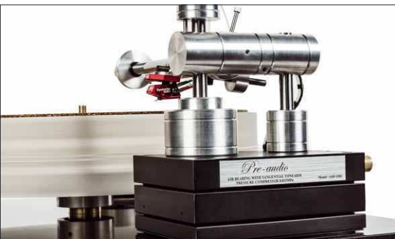
Der Tangentialtonarm ist auf der Lagerseite über zwei Metallzylinder mit dem Unterbau verbunden