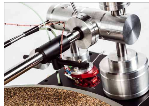
Hier passiert's: Durch den Schlauch wird Druckluft in die Hülse geblasen, der Arm schwebt auf dem resultierenden Luftpolster

Kompressor für die Drucklufterzeugung steckt nämlich in dem Montageblock des Tonarms und macht dort völlig unspektakulär seinen Job. Nichts zischt und pfeift, nichts brummt und summt, das funktioniert einfach. Ich kann noch nicht mal mit Sicherheit sagen, wo die Luft angesaugt wird. Das Ganze ist natürlich wartungsfrei – sehr beeindruckend. Und wohin mit der dort erzeugten Druckluft? Durch einen dünnen, sehr weichen Silikonschlauch ins Innere einer zylindrischen Kunststoffhülse, an der der eigentliche Tonarm montiert ist. Die Konstruktion ist so etwas wie eine Kombination aus einem Clearaudio- und einem Kuzma-Tangentialtonarm: Auch Kuzma verwendet eine auf einem runden Metallstab verschiebbare Hülse, in die Luft eingeblasen wird. Dadurch bildet sich ein Luftpolster zwischen Hülseinnenseite und Stab aus. Dadurch kann die Hülse – und damit der Arm – praktisch reibungsfrei gleiten und sich drehen. Damit kann